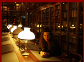
La Marina a la Biblioteca de l’Ateneu Barcelonès