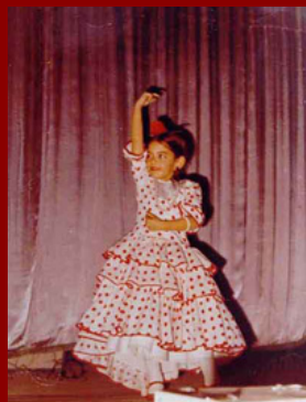
La Marina de nena