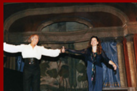
Ensayo para el Festival de Ludwigsburg