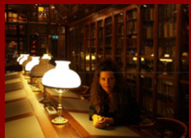
Marina en la Biblioteca del Ateneu Barcelonès