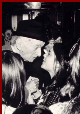
Con el compositor Frederic Mompou